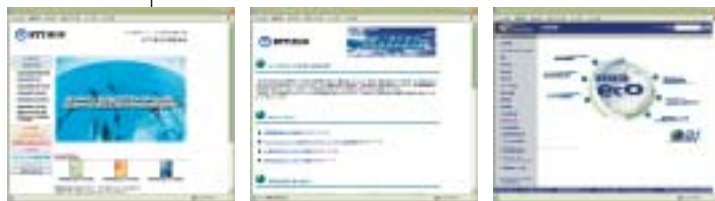
NTT東日本 NTT西日本 NTTコミュニケーションズ