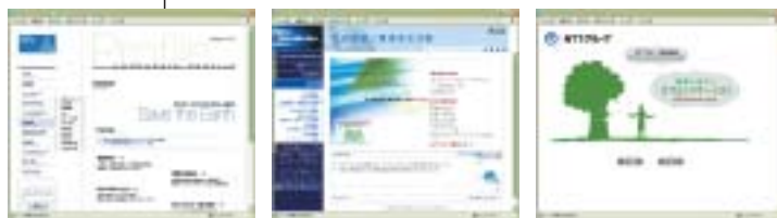
NTTデータ NTTコム NTT(持株会社)