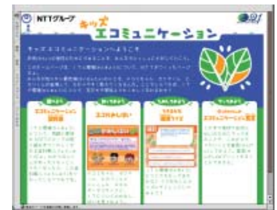
「キッズエココミュニケーション」ウェブサイト http://www.ntt.co.jp/kankyo/kids/index.html

2003年度の報告書についても、皆さまからの率直なご意見やご助言をいただければ幸いです。今後の環境保護、コミュニケーション活動に反映していきます。