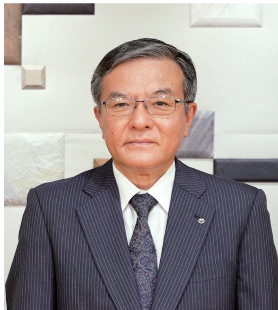
代表取締役社長 社長執行役員

株主の皆さまにおかれましては、より一層のご理解とご支援を賜りますよう、よろしくお願い申し上げます。