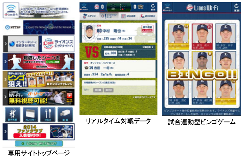
専用サイトトップページ